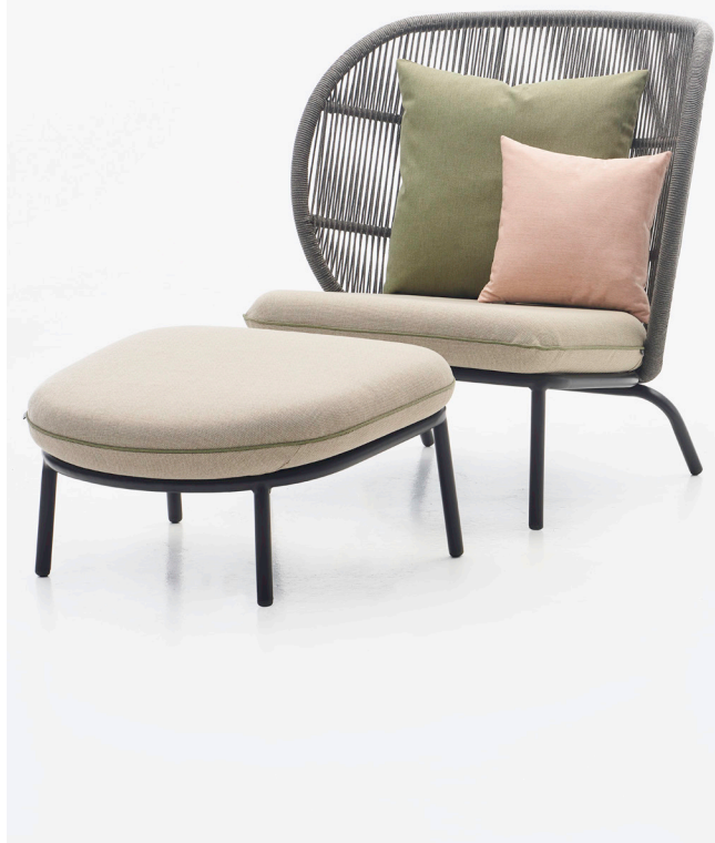
KODO COCOON & KODO FOOTREST