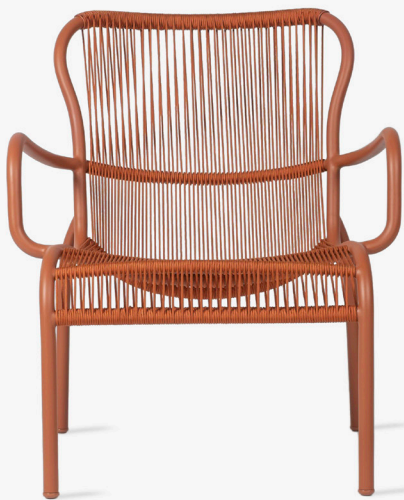
LOOP LOUNGE CHAIR TERRACOTTA