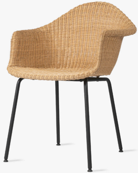
FINN DINING CHAIR