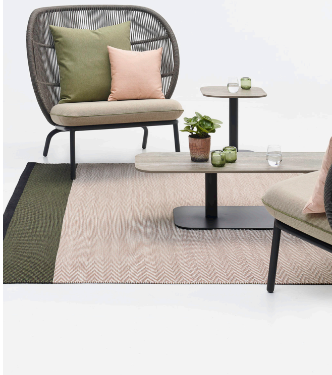
KODO COCOON - SIDE TABLE - COFFEE TABLE