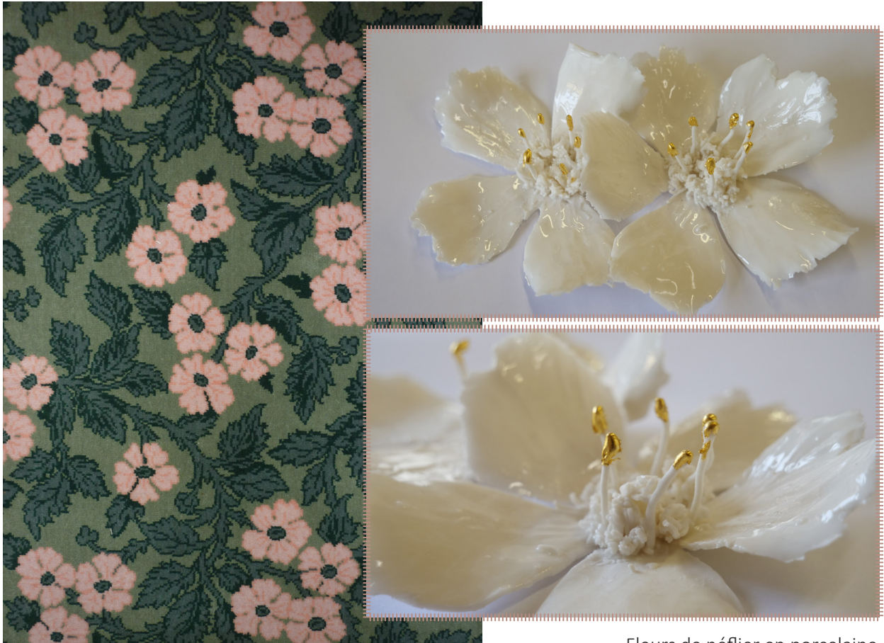
Document Codimat "Fleurs de néflier"