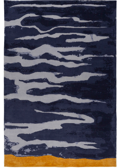
MARIE-EUGENIE DE POURTALES