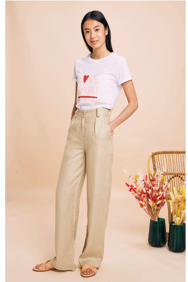
T-shirt Love Story