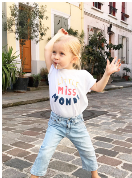
T-shirt Little Miss Monde