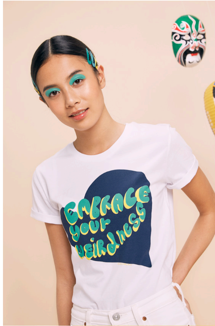
T-shirt Embrace your Weirdness