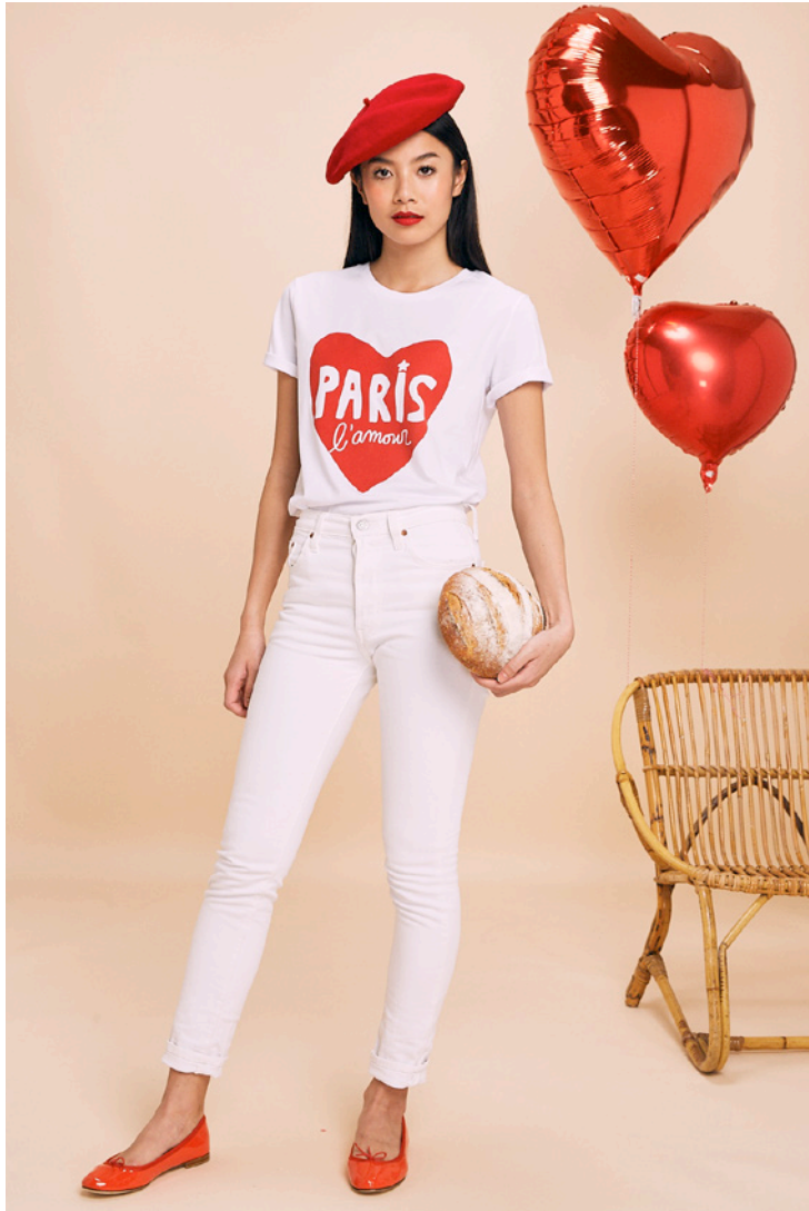
T-shirt Paris l'amour