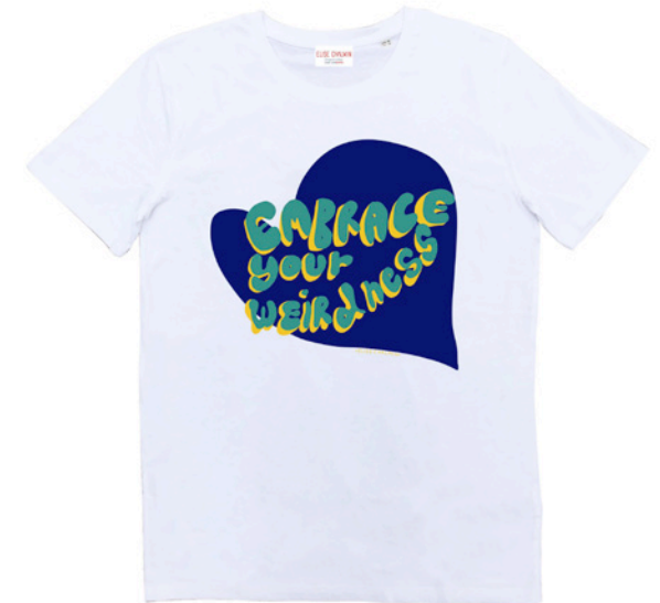
T-shirt Embrace your weirdness