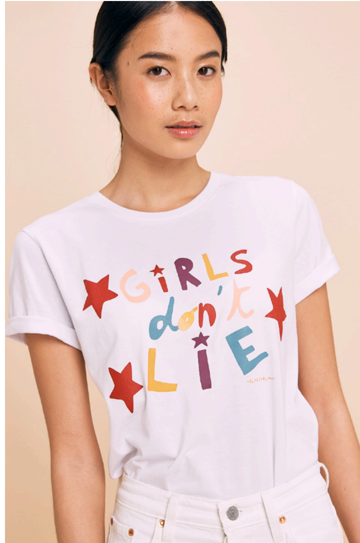
T-shirt Girls don't lie