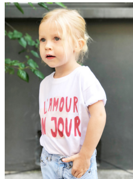
T-shirt L'amour un jour