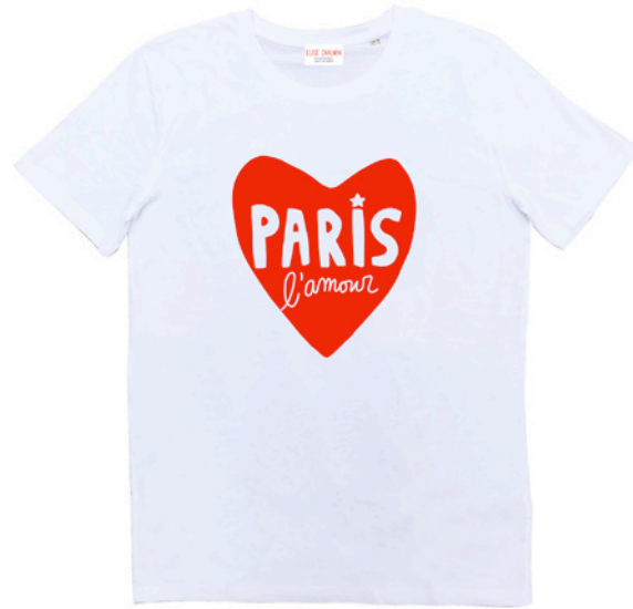
T-shirt Paris l'Amour