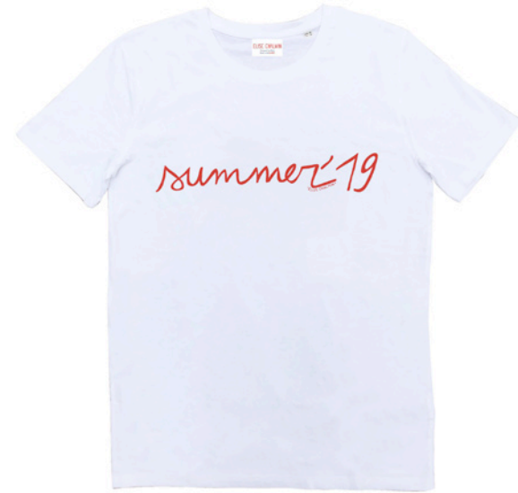
T-shirt Summer 19