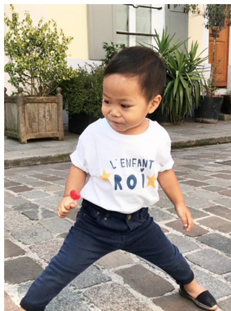
T-shirt L'enfant roi