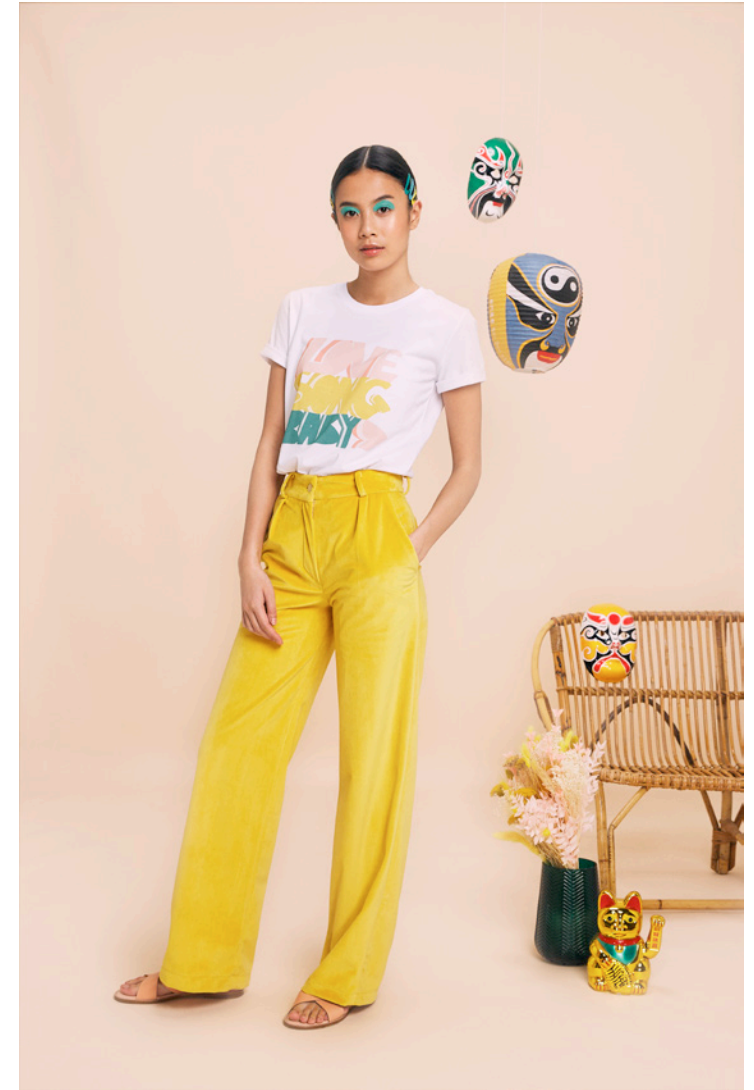
T-shirt Love Song Baby