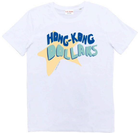
T-shirt Hong Kong Dollars