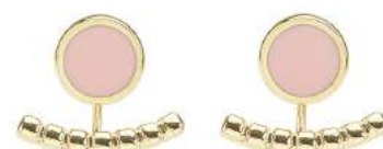
ROSE POUFRE BUP09-COM-OPU10