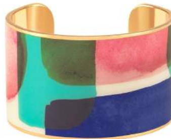
BLEU CLEMATIS BUP09-AQU-MAI46 MANCHETTE 4CM