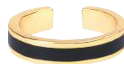
NOIR BUPO6-BAN-BAG04 PERMANENT