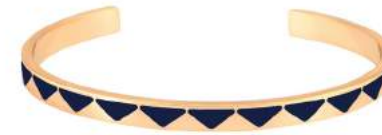
BLEU NUIT BUP09-BOL-BA044