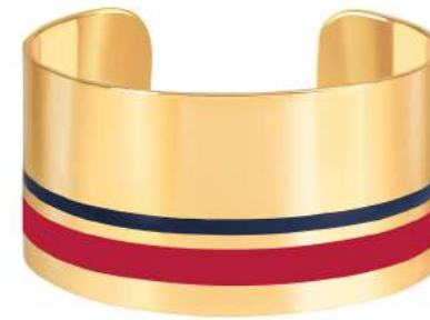
ROUGE VELOURS / BLEU NUIT BUP09-CAS-MAU25