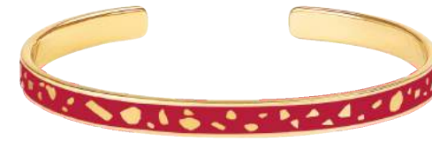
ROUGE VELOURS BUP09-LUC-BA025 JONC 0,7CM