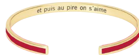
ROUGE VELOURS BUPO9-BR-BAO25

Pack d'implantation joncs : 3 pièces à la couleur pour chaque référence de jonc