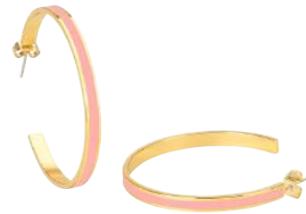
ROSE POUFRE BUP09-BAN-OCR10