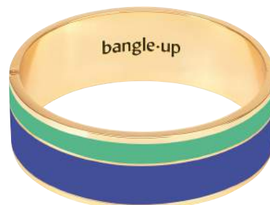
BLEU CLEMATIS / VERT OPAL BUP09-VAP-BFA4636 BUP09-VAP-BFA46-T2

Disponible en 2 tailles Largeur : 2cm (3 pièces à la couleur)