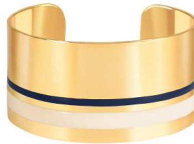
BLANC SABLE / BLEU NUIT BUP09-CAS-MAU03