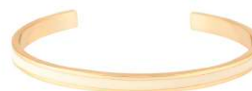
BLANC SABLE BUPO3-BAN-BA003 PERMANENT