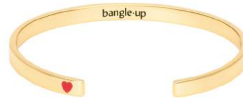
OR LIGHT / ROUGE VELOURS BUPO9-GHE-BAO0025