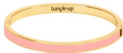
ROSE POUFRE BUP09-B05-BFA10