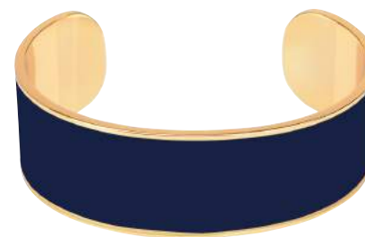
BLEU NUIT BUP09-B20-BS044 JONC 2CM