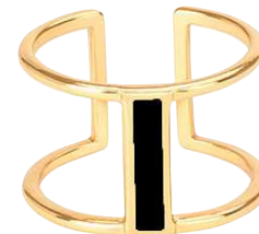
NOIR BUP06-LUN-BAG04 PERMANENT