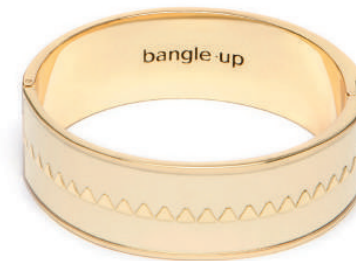
BLANC SABLE BUPO3-BOL-BFA03-T1 PERMANENT