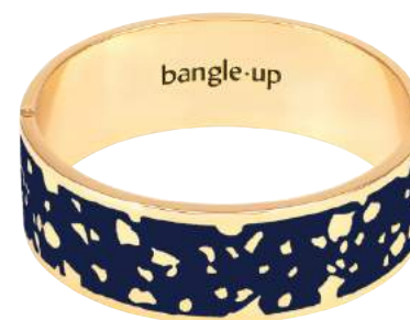
BLEU NUIT BUP08-LUC-BFA44 - T1 & T2 RECONDUIT