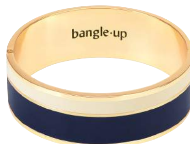
BLEU NUIT / BLANC SABLE BUP07-VAP-BFA4403 BUP09-VAP-BFA44-T2