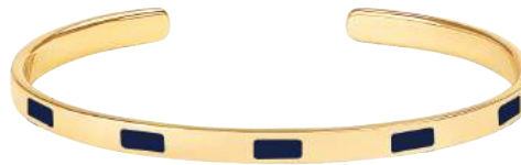
BLEU NUIT BUP09-TEM-BA044 JONC 0,44CM