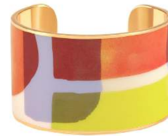
MANDARINE BUP09-AQU-MAI79 MANCHETTE 4CM