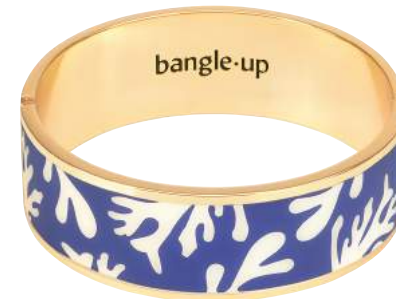
BLEU CLEMATIS / BLANC SABLE BUPO9-NEP-BFA46 BRACELET 2CM