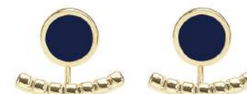
BLEU NUIT BUP09-COM-OPU44