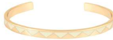
BLANC SABLE BUP03-BOL-BA003 PERMANENT

Pack d'implantation joncs : 3 pièces à la couleur pour chaque référence de jonc