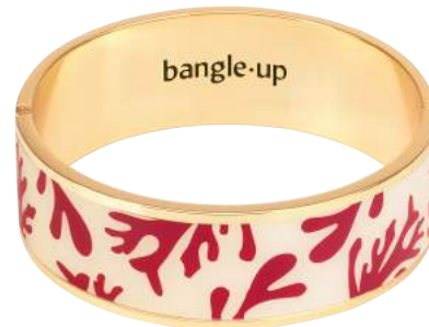
BLANC SABLE / ROUGE VELOURS BUPO9-NEP-BFA03 BRACELET 2CM