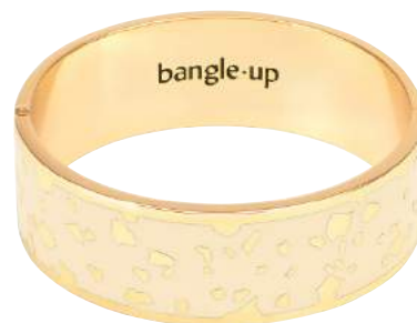
BLANC SABLE BUP08-LUC-BFA03 - T1 & T2 RECONDUIT

Disponible en 2 tailles Largeur : 2cm (3 pièces à la couleur)