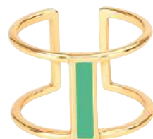
VERT OPAL BUP09-LUN-BAG36

Pack d'implantation : 3 pièces à la couleur des références BANGLE et LUNE