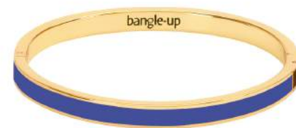
BLEU CLEMATIS BUP09-B05-BFA46