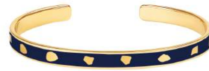
BLEU NUIT BUP09-JUD-BA044 JONC 0,7CM