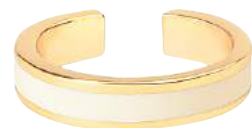
BLANC SABLE BUPO6-BAN-BAG03 PERMANENT