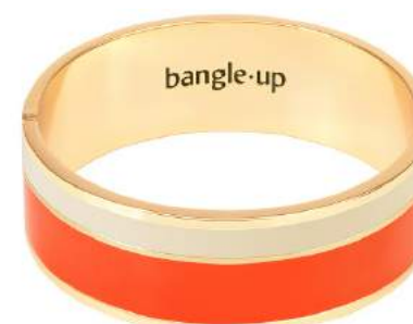
TANGERINE / BLANC SABLE BUP07-VAP-BFA8003 BUP09-VAP-BFA80-T2