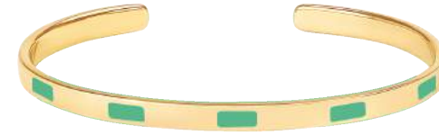
VERT OPAL BUP09-TEM-BA036 JONC 0,44CM