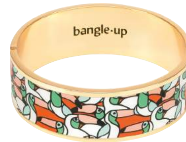
TANGERINE BUP05-JAN-BFA80 BUP09-JAN-BFA80-T2 RECONDUIT