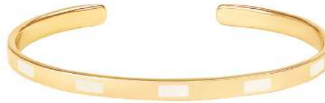
BLANC SABLE BUP09-TEM-BA003 JONC 0,44CM