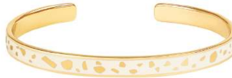
BLANC SABLE BUP09-LUC-BA003 JONC 0,7CM

Pack d'implantation joncs : 3 pièces à la couleur pour chaque référence de jonc