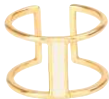
BLANC SABLE BUP07-LUN-BAG03 PERMANENT