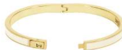
BLANC SABLE BUP07-B05-BFA03 PERMANENT