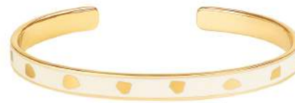
BLANC SABLE BUP09-JUD-BA003 JONC 0,7CM