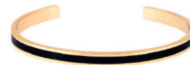
NOIR BUPO3-BAN-BA004 PERMANENT