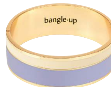
LAVANDE / BLANC SABLE BUP09-VAP-BFA6403 BUP09-VAP-BFA64-T2