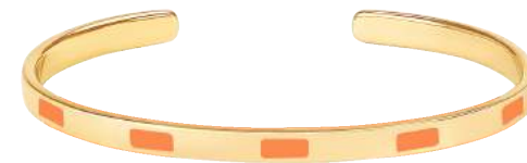
MANDARINE BUP09-TEM-BA079 JONC 0,44CM