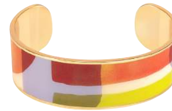
MANDARINE BUP09-AQU-BS079 JONC 2CM