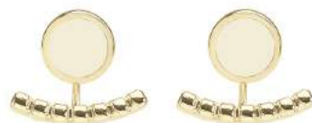
BLANC SABLE BUP09-COM-OPU03

Boucles d'oreilles en deux parties, en laiton doré émaillé (3 pièces à la couleur)