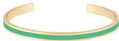
VERT OPAL BUPO9-BAN-BA036

Pack d'implantation joncs : 3 pièces à la couleur pour chaque référence de jonc