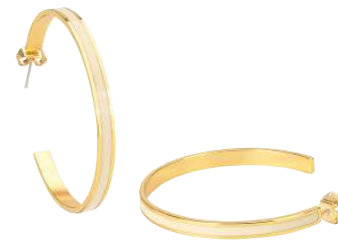
BLANC SABLE BUP06-BAN-OCR03 PERMANENT