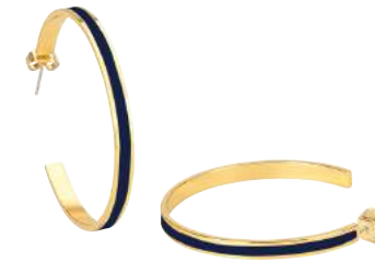
BLEU NUIT BUP09-BAN-OCR44