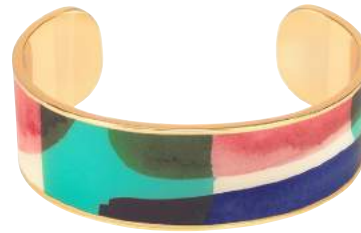
BLEU CLEMATIS BUP09-AQU-BS046 JONC 2CM