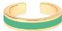
VERT OPAL BUPO9-BAN-BAG36

Pack d'implantation : 3 pièces à la couleur des références BANGLE et LUNE