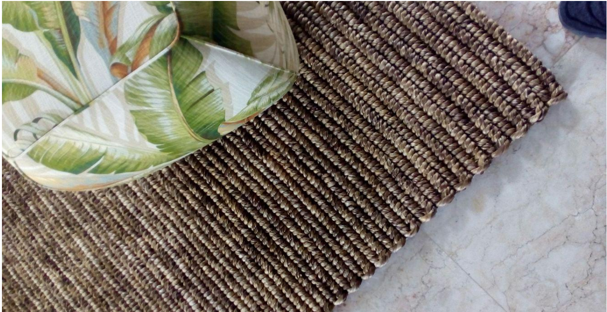
Tapis en abaca par WEAVEMANILA, INC.

Par sa texture, l'abaca – la plus robuste des fibres naturelles – est le matériau parfait pour des tapis et nattes. Le procédé rigoureux appliqué à l'abaca brut avant son tissage contribue à la douceur et luxueuse texture de ces nattes et tapis. Ces techniques séculaires combinées à des designs ingénieux ont contribué à la capacité du produit à susciter une sensation de luxe et de confort. Les techniques de tissage secrètes de ces nattes se passent de génération en génération, conservant à travers les âges leur forme et fonction.