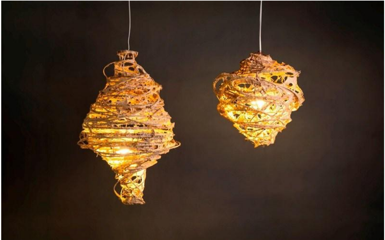
Lampes Nid d'Abeille par CDO HANDMADE PAPER CRAFTS

A partir de fibres naturelles provenant de tribus indigènes du sud des Philippines, CDO Handmade Paper produit de solides et excentriques luminaires à partir de papier. CDO Handmade tire parti des aspects durables et de l'abondance des matériaux bruts pour créer des pièces tout aussi fonctionnelles que décoratives. Ces nids d'abeille faits à partir de bambou apportent chaleur et sophistication à n'importe quelle maison.