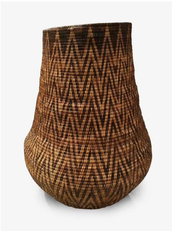
Ori-Min by L'AURAS Y LEVI, INC.

Dans un pays riche en matériaux naturels, pas étonnant que les Philippins trouvent inspiration et ressources même dans des plantes grimpantes ternes et communes. Employant des membres hautement qualifiés de tribus de tisseurs des plaines, L'Auras Y Levi transforme Nito , une plante grimpante, en un large éventail de décoration de maison, de meubles, et de paniers et autre rangements, qui reflètent des motifs traditionnels avec une fibre contemporaine.