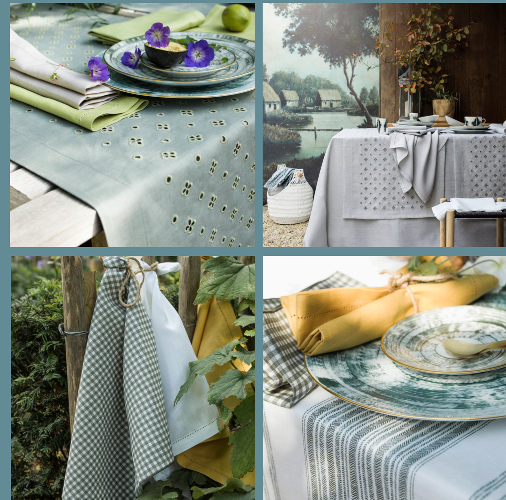
1. Serviette de table Vichy, pur lin imprimé, 17€. - 2. Nappe Luxembourg argent, existe en olive, made in France, pur lin brodé : tête à tête : 129€ / nappe : à partir de 299€. - 3. Set de table Capri olive, ocre et rouge basque, pur lin imprimé : set de table : 25€ / nappe : à partir de 299€. 4. Set de table Cannage, satin de coton, enduction acrylique : set de table : 15€ / tête à tête : 49€. - 5. Nappe Amalfi olive, existe en rouge basque, pur lin : tête à tête : 89€ / nappe à partir de 179€.