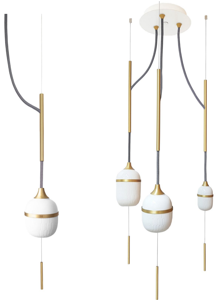
Suspension solo / Moyen 20 x 102 cm 618€