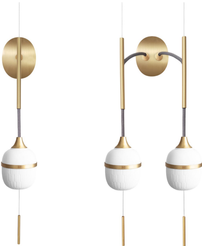
Applique suspendue solo / Moyen 9,6 x 14 x 52,5 cm 618€

Tout en poésie et en raffinement, des éléments de laiton brossé prolongent les suspensions comme un mobile. Assemblées en grappe à différentes hauteurs, ou en solitaire, ces suspensions sublimeront votre espace.