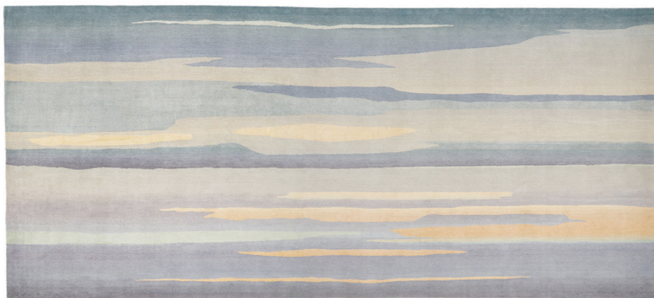
Skyscape, size 2.35 x 5.00m