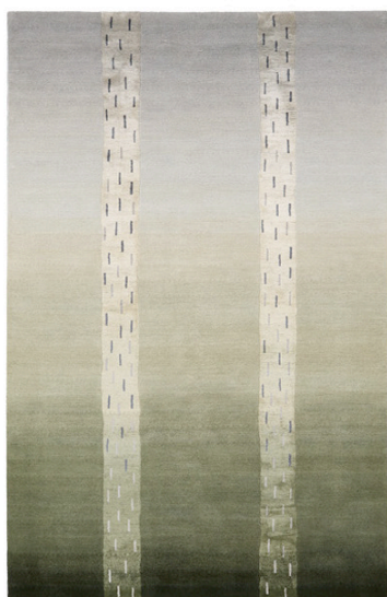
Rivulets, size 1.90 x 3.00m