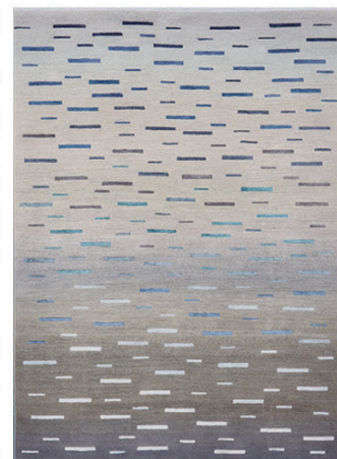
Sea mist, size 1.70 x 2.35m