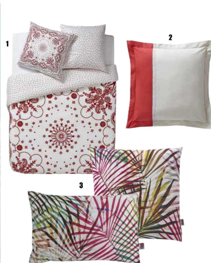
1. Linge de lit Bandana rouge : housse de couette 129€ // taie 33,5€. - 2. Linge de lit Toi & Moi Bandana : housse de couette 129€ // taie : 33,5€. - 1. Linge de lit Tropic : housse de couette 129€ // taie 33,5€. Collab' Essix x Bensimon