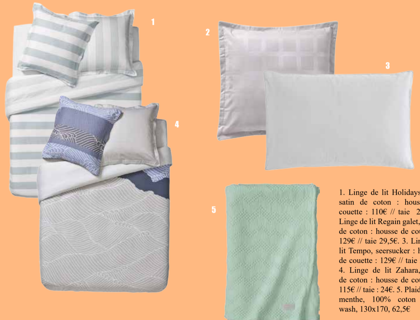
1. Linge de lit Holidays jade, satin de coton : housse de couette : 110€ // taie 25€. 2. Linge de lit Regain galet, piqué de coton : housse de couette : 129€ // taie 29,5€. 3. Linge de lit Tempo, seersucker : housse de couette : 129€ // taie 29,5€. 4. Linge de lit Zahara, satin de coton : housse de couette : 115€ // taie : 24€. 5. Plaid Malo menthe, 100% coton stone wash, 130x170, 62,5€