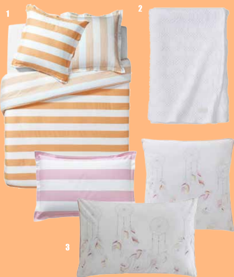
1. Linge de lit Holidays melon et pétale, satin de coton : housse de couette 110€ // taie 25€. 2. Plaid Malo blanc, 100% coton stone wash, 130x170, 62,5€. 3. Linge de lit Boho, percale de coton : housse de couette 115€ // taie 24€.