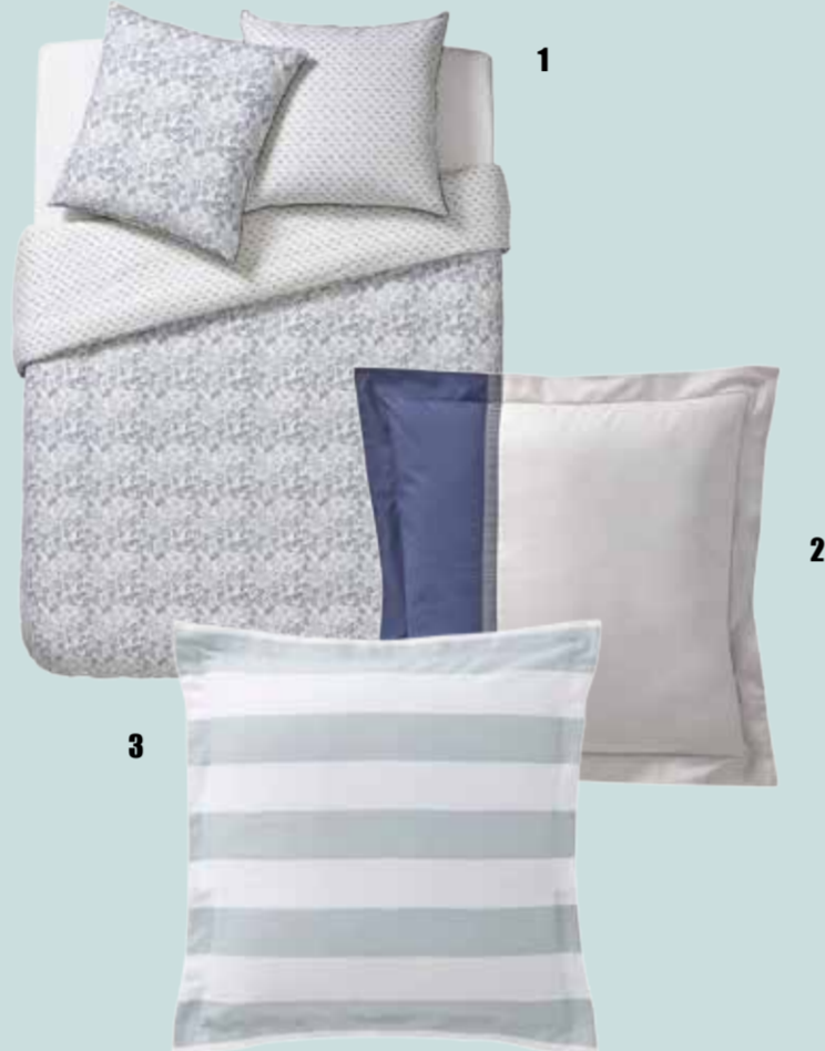
1. Linge de lit Cadence, percale de coton : housse de couette 129€ // taie : 35€. 2. Linge de lit Toi & Moi Zaharah bleu, percale de coton : housse de couette 129€ // taie 29,5€. 3. Linge de lit Holidays jade, satin de coton : housse de couette : 110€ // taie 25€