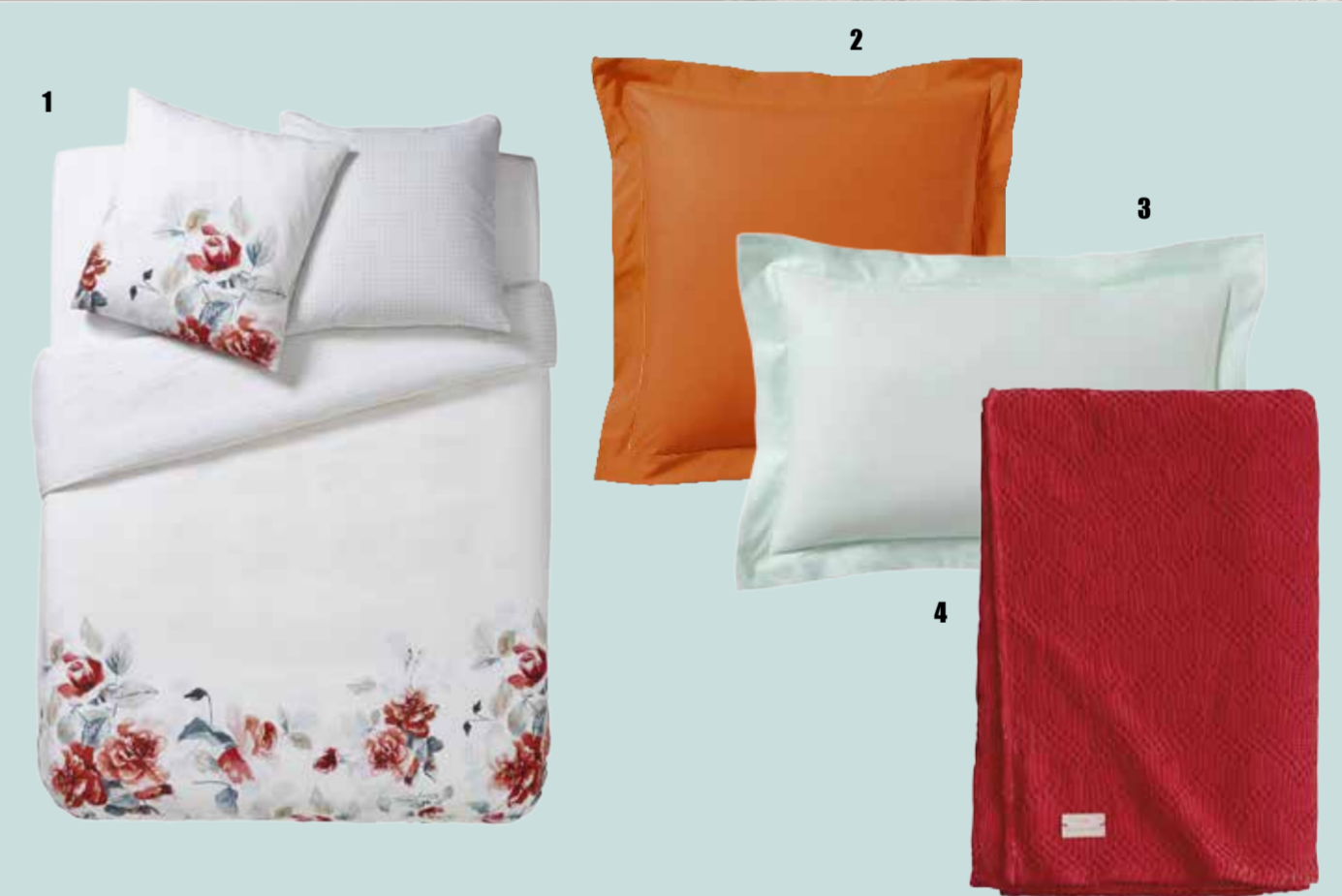
1. Linge de lit Émotion, percale de coton : Housse de couette 129€ // Taie : 35€. 2. Linge de lit uni épice, percale de coton : Housse de couette : 129€ // Taie : 21,5€. 3. Linge de lit uni menthe glacée, percale de coton : Housse de couette : 129€ // Taie : 21,5€. 4. Plaid Malo sienne, 100% coton stone wash, 130x170, 62,5€.